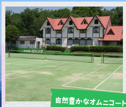
自然豊かなオムニコート