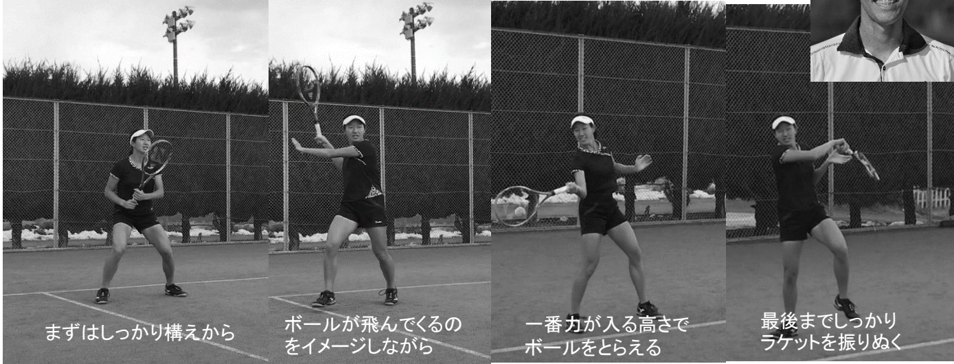
まずはしっかり構えから